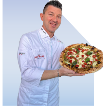
Carthage Africa Pizza Cup كأس قرطاج أفريقيا للبيتزا