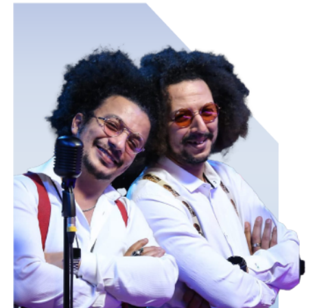
Gala Dinner حفلة عشاء