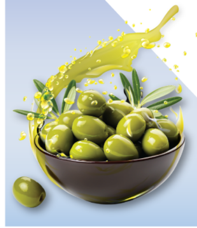
International Olive Oil Show المعرض الدولي لزيت الزيتون