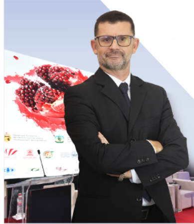
Conferences & Workshop المؤتمرات وورش العمل