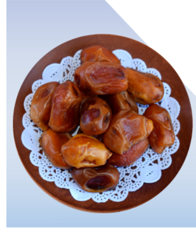
International Dates Show المعرض الدولي للتمر