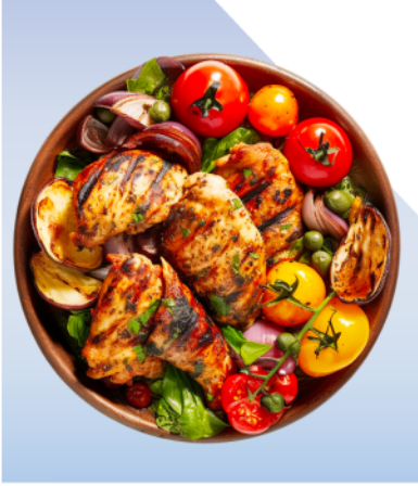
International Culinary Heritage Days Festival مهرجان الأيام الدولية لتراث الطبخ