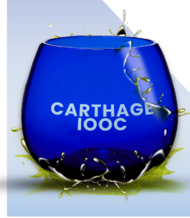
Carthage IOOC مسابقات قرطاج الدولية لزيت الزيتون